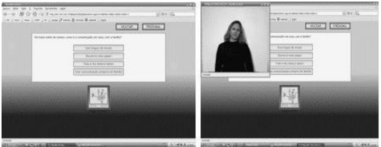
Figura 1. Interface gráfica do questionário.

Observe a forma de apresentação da Figura 1. Observe que o título da figura (obrigatório) deve ser inserido abaixo da figura, iniciando com a palavra e número em itálico com ponto final. Segue o texto do título, em fonte normal, com a primeira palavra em letra maiúscula. O título da figura termina com um ponto final.